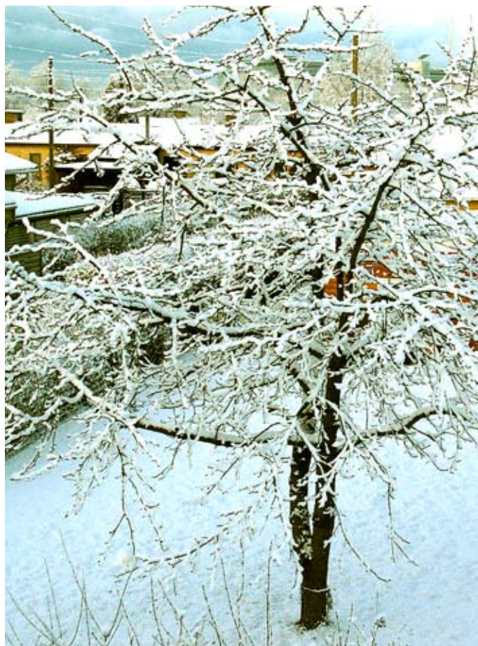
Vinteren kom i særdeleshed forbi Hvidovre. Smukt er det, men sneen skal jo ryddes væk fra vores fortove og veje.

Regnskabet blev herefter enstemmigt vedtaget.