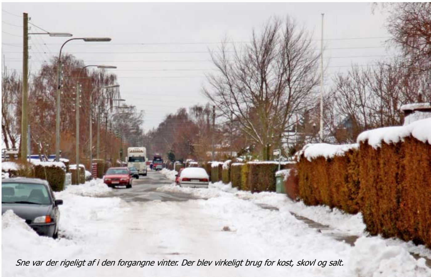
Sne var der rigeligt af i den forgangne vinter. Der blev virkelig brug for kost, skovl og salt.

Der var ingen kandidater til posten som kasserer.