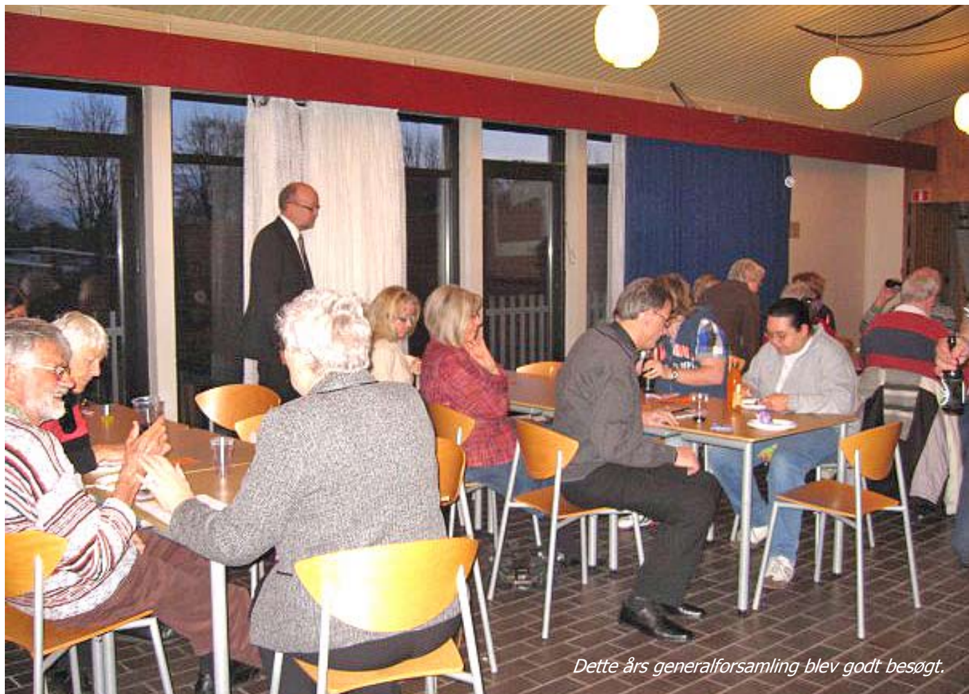
Dette års generalforsamling blev godt besøgt.

Ændring af vedtægternes § 28 som udsendt med indkaldelsen. (Generalforsamlingsmandat til bevilling af aktivitetstilskud på op til kr. 10.000 i samme år som generalforsamlingens afholdelse,